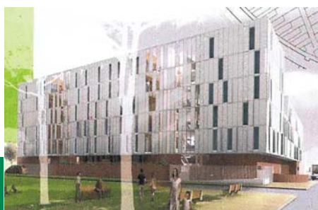
Les logements Andromède près du centre