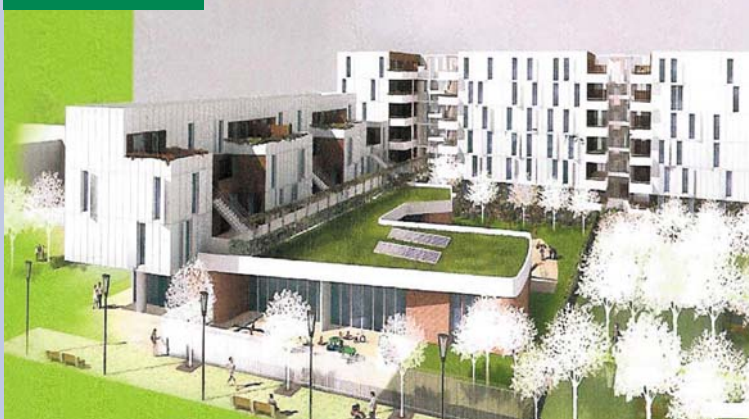
Le centre petite enfance