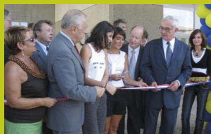
'inauguration officielle du gymnase Saint-Exupéry a ouvert de nouveaux créneaux pour les associations